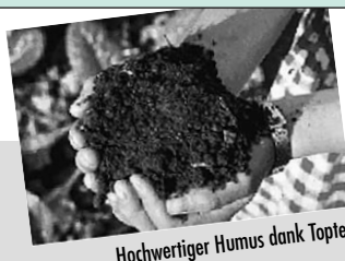
Hochwertiger Humus dank Toptex

Mit Toptex Kompostschutzvlies erhalten Sie in kurzer Zeit hochwertigen Kompost. Toptex schützt Ihren Kompost vor zu viel Regen und Sonne, schützt vor Auswaschung der Nährstoffe und lässt Ihren Kompost atmen.